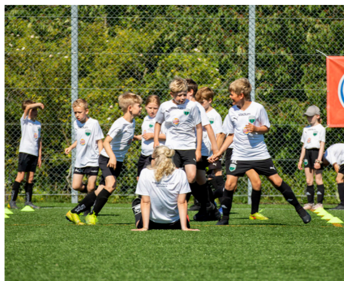
Bilder från Hyllie Camp 15-18 juni.

men även här ser vi utvecklingspotentialen och vi ser med tillförsikt fram emot 2021.