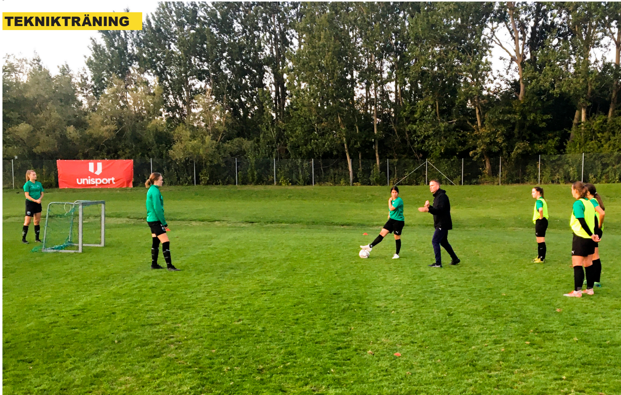
Pro Defending-träningarna började under tidig höst och har genomförts vid tio tillfällen. Fokus har varit på att ge spelarna så många verktyg som möjligt när de går ut på planen.

förmåga att se saker i periferin, att se en rörelse utan att titta i just den riktningen.